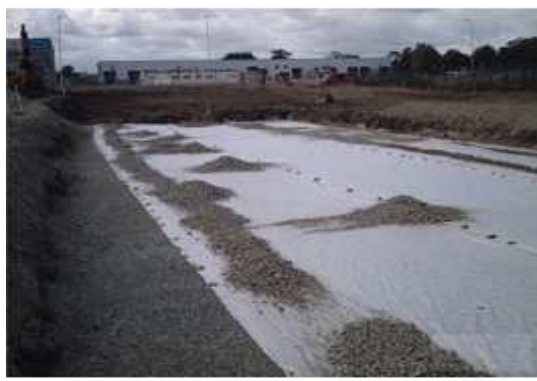
8. Układamy geowłókninę, a nad nią wykonujemy zasypkę, którą zagęszczamy co 15 cm