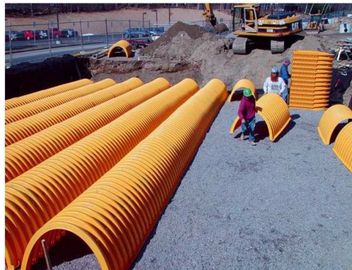
4. Układamy ciągi komór drenażowych (odstęp między rzędami minimum 15 cm)