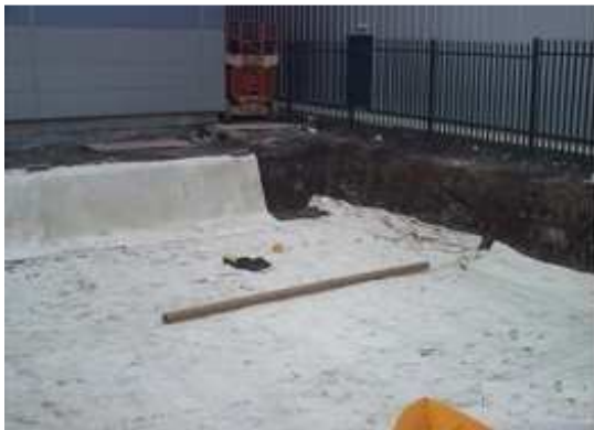
1. Wykonujemy wykop, następnie wykładamy wykop geowłókniną