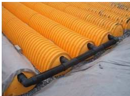
6. Montujemy rurę dystrybucyjną