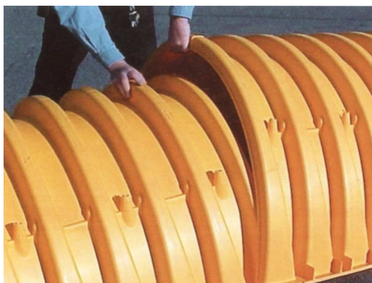
5. Dwie sąsiednie komory powinny być połączone na zakładkę