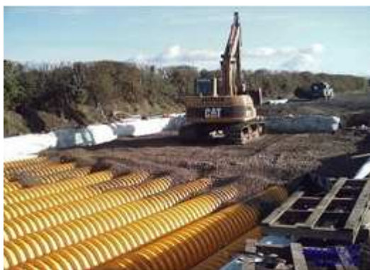
7. Warstwa tłucznia zgodna z projektem, minimum 15 cm