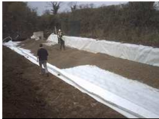
2. Na dnie umieszczamy warstwę minimum 15 cm obsypki z tłucznia (uziarnienie 31÷63 mm)