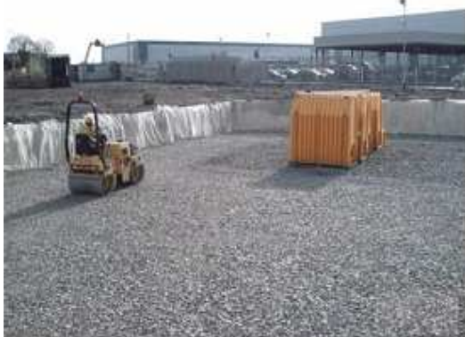
3. Tłuczeń łamany zgęszczamy do min. 95% gęstości standardowej Proctora