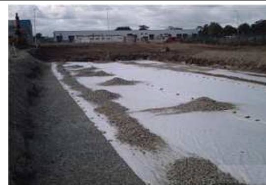
9. Układamy geowłókninę, a nad nią wykonujemy zasypkę, którą zagęszczamy co 15 cm