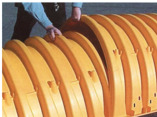
5. Dwie sąsiednie komory powinny być połączone na zakładkę