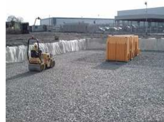
3. Tłuczeń łamany zgęszczamy do min. 95% gęstości standardowej Proctora