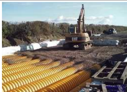
8. Warstwa tłucznia zgodna z projektem, minimum 15 cm