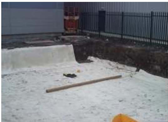
1. Wykonujemy wykop, następnie wykładamy wykop geowłókniną