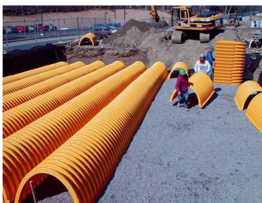
4. Układamy ciągi komór drenazowych (odstęp między rzędami minimum 15 cm)