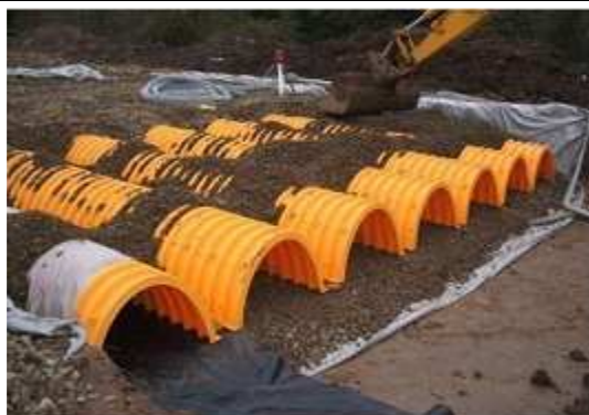
7. Przykrycie systemu wykonujemy za pomocą obsypki z tłucznia